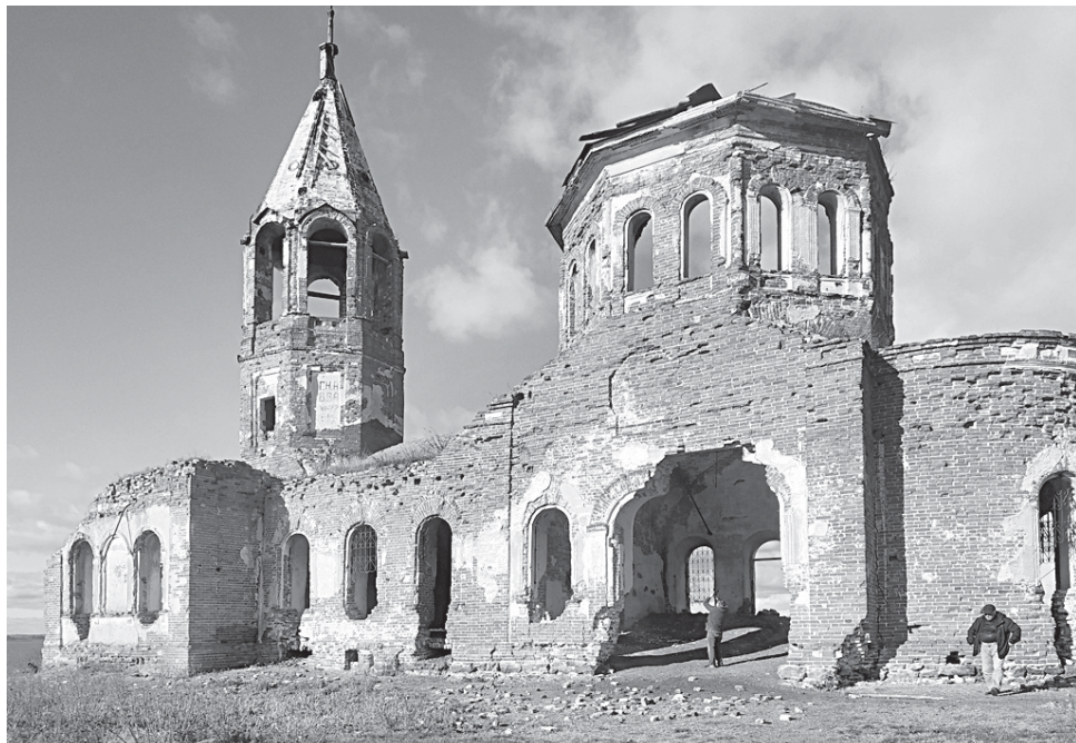
Храм Владимирской иконы Божией Матери в селе Беликуль.