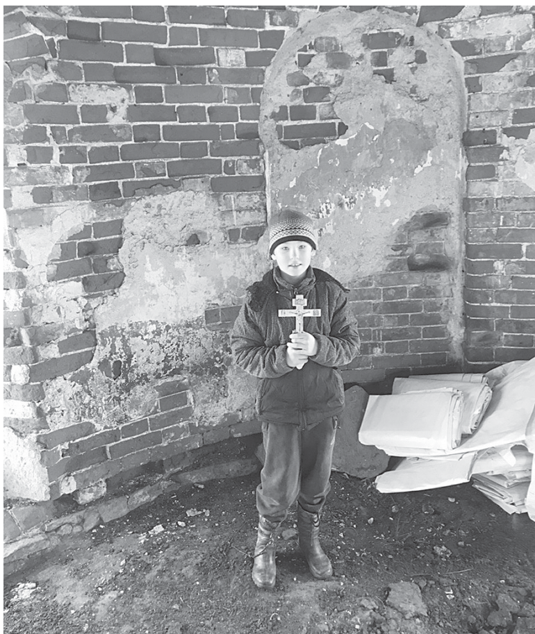
Храм в деревне Попово.