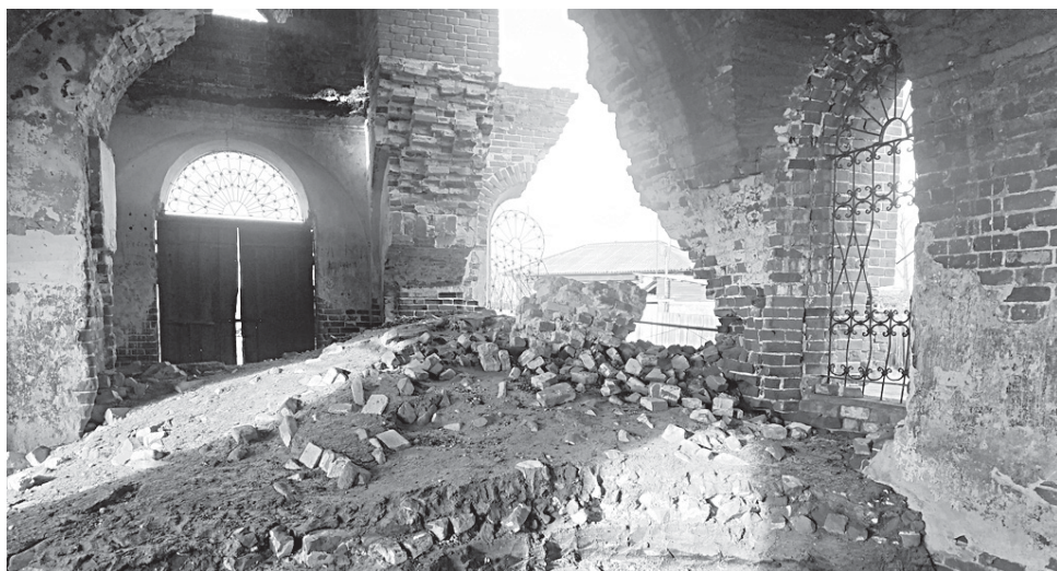
Храм Михаила Архангела в селе Феклино.