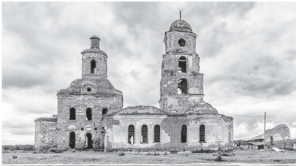
Храм святых апостолов Петра и Павла в селе Нижнепетропавловском.