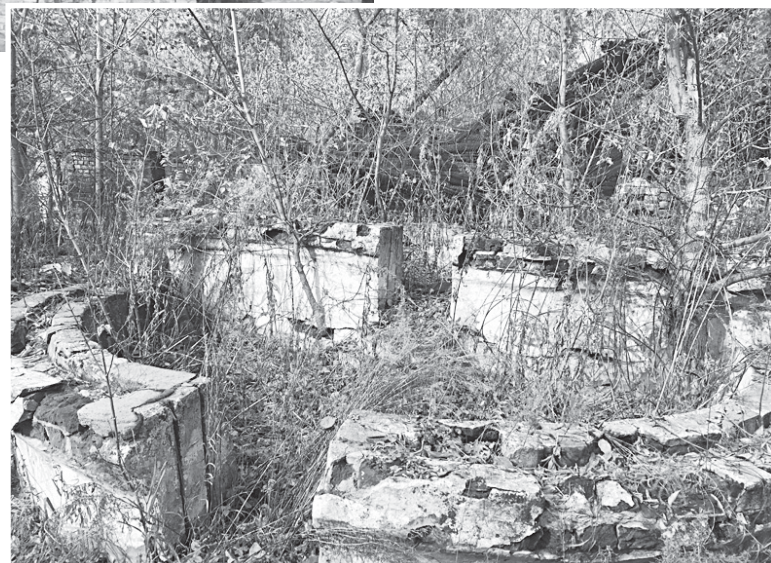
Фонтан перед главным домом.

Размеры впечатляют, но смотреть на это больно. Осо-