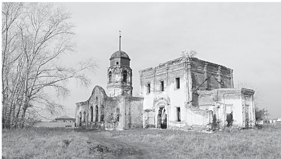
Ильинская церковь в селе Сугояк.